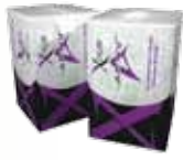
Két doboz Xocai